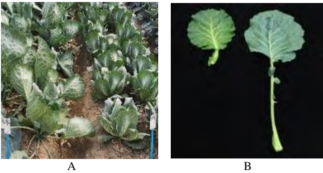
图1研究群体亲本及表型性状

在结球甘蓝F 2 分离群体中，458份材料的叶柄/叶片比值介于0.17~0.68间。Q-Q图上的散点均靠近检测线，该分布曲线Skewness=-0.613、Kurtosis=0.623，均小于1，说明该组数据符合正态分布规律(图2)，可以进行BSA-seq分析。